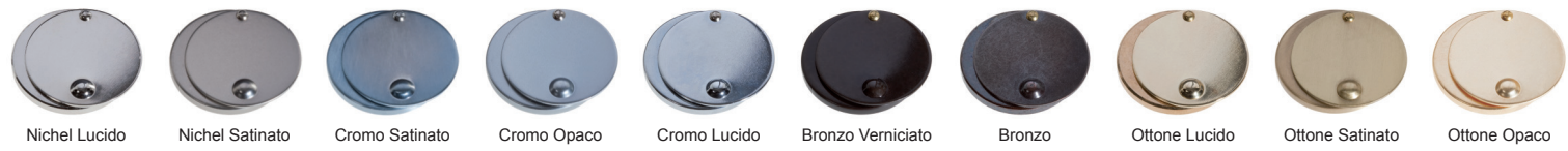
Nichel Lucido Nickel Satinato Cromo Satinato Cromo Opaco Cromo Lucido Bronzo Verniciato Bronzo Ottone Lucido Ottone Satinato Ottone Opaco